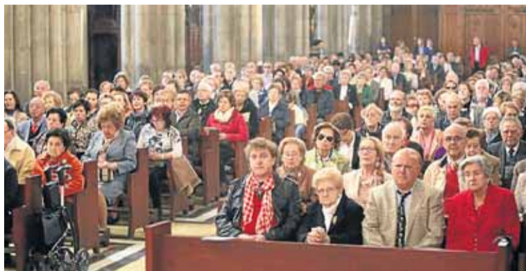
El templo se llenó para seguir la Misa de Gaita.